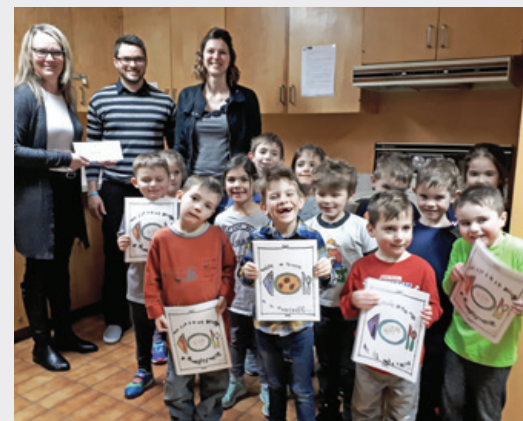
École de la Tourelle