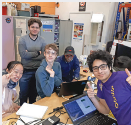
École secondaire Cavalier-De LaSalle