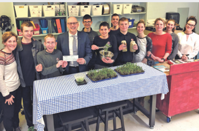
École du Triolet